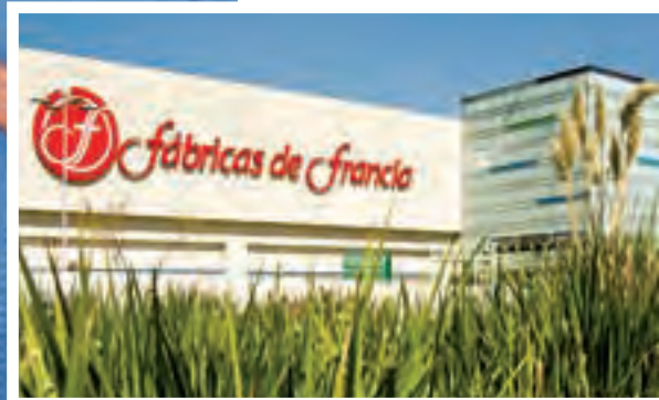
Fábricas de Francia Lago de Guadalupe, una de las dos aperturas de este formato en 2014.